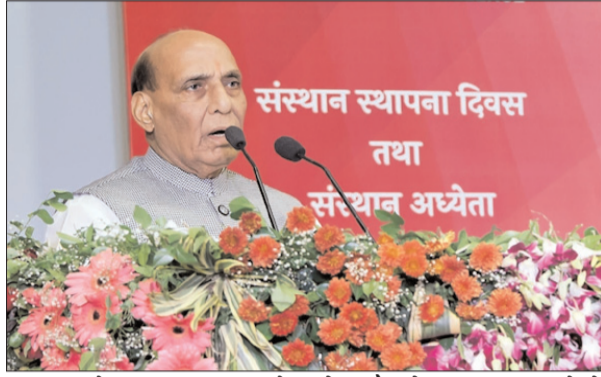
संस्थान स्थापना दिवस तथा संस्थान अध्यक्षता

हमारा रक्षा निर्यात करीब दो हजार करोड़ रुपये था, जो आज 21 हजार करोड़ रुपये के रिकॉर्ड आंकड़े को पार कर गया है। हमने 2029 तक 50 हजार करोड़ रुपये का निर्यात लक्ष्य रखा है। उन्होंने कहा कि भारत में निर्मित उपकरण दूसरे देशों को निर्यात किए जा रहे हैं। सिंह ने अपने भाषण में युद्ध में आमूलचूल परिवर्तन का उल्लेख करते हुए कहा कि सूचना युद्ध, कृत्रिम मेधा (एआई) आधारित युद्ध, छद्म युद्ध, अंतरिक्ष युद्ध और साइबर हमले जैसे अपरंपरागत तरीके बड़ी चुनौती पेश कर रहे हैं। उन्होंने इस तरह के हमलों से लड़ने के लिए सेना को अच्छी तरह से प्रशिक्षित और सुसज्जित करने की आवश्यकता पर बल दिया और महू में प्रशिक्षण केंद्रों के बहुमूल्य योगदान की सराहना की। सिंह ने बदलते समय के अनुसार प्रशिक्षण