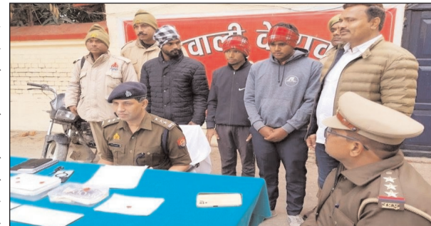
08.04.2025 को समय 04.08 बजे सुबह गिरफ्तार किया गया, अभियुक्तगण के पास से