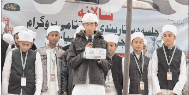
विकास की तरफ अग्रसर हो सके। उन्होंने दस्तारबंदी की अहमियत पर प्रकाश डालते हुए कहा कि दस्तारबंदी न