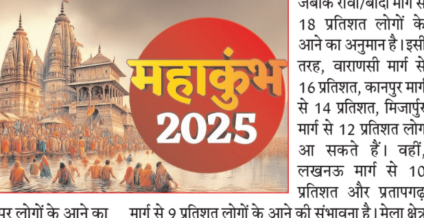
जौनपुर (उत्तरशक्ति)। प्रयागराज में महाकुंभ 2025 में यातायात को लेकर विशेष प्रबंध किए गए हैं। यातायात पुलिस ने प्रमुख स्नान पर्व और सामान्य दिनों के लिए यातायात योजना तैयार कर ली है। प्रयागराज आने वाले सभी 7 प्रमुख मार्गों पर यातायात प्रबंधन को लेकर व्यापक तैयारियां की जा रही हैं। ऐसा अनुमान है कि जौनपुर-मुंगराबादशाहपुर-फूलपुर-रीवा-बांदा और वाराणसी मार्गों से सर्वाधिक ट्रैफिक आ सकता है। जबकि कापुर और मिजापुर मार्ग से भी बड़े पैमाने पर लोगों के आने का अनुमान है। ऐसे में आने वाले लोगों को बिना किसी असुविधा के पावन स्नान कराने के लिए यातायात को सुदृढ़ किया गया है। उल्लेखनीय है कि इस बार महाकुंभ में 40 करोड़ से ज्यादा लोगों के आने की संभावना है और यातायात पुलिस सभी के स्वागत को तैयार है। जौनपुर-मुंगराबादशाहपुर-फूलपुर मार्ग से सर्वाधिक ट्रैफिक को संभालना यातायात पुलिस के द्वारा तैयार की गई यातायात योजना के अनुसार विभिन्न दिशाओं से महाकुंभ मेला और कमिश्नरेट क्षेत्र में आने के 7 प्रमुख मार्ग हैं। इनमें जौनपुर मार्ग, वाराणसी मार्ग, मिजापुर मार्ग, रीवा/बांदा मार्ग, कानपुर मार्ग, लखनऊ मार्ग और प्रतापगढ़ और मिजापुर मार्ग से भी बड़े पैमाने पर लोगों के आने का अनुमान है। मेला क्षेत्र में पैदल यात्रियों के लिए एकल मार्गों का निर्धारण सामान्य दिनों के लिए सभी प्रमुख 7 मार्गों की अलग-अलग यातायात योजना तैयार की गई है। बड़े एवं छोटे वाहनों के लिए अलग-अलग पार्किंग स्थलों का निर्धारण किया गया है। सामान्य दिनों में पैदल यातायात पर शाह क्षेत्र में किसी प्रकार का कोई प्रतिबंध नहीं रहेगा। लेकिन मेला क्षेत्र में एकल दिशा मार्गों का प्रयोग होगा। साथ ही साथ अगर सामान्य दिनों में भीड़ अत्यधिक होती है तो एस्पलैनी कुम्भ मेला द्वारा मौके की स्थिति के अनुसार डाववर्जन का निर्णय लिया जाएगा।