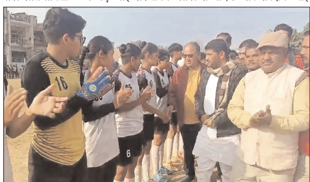
वाराणसी की पांच बेटियां राष्ट्रीय खेलों में भाग लेंगी।