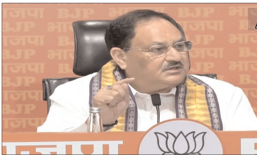
जे पी नड्डा ने लोकसभा में पूरक प्रश्नों का उत्तर देते हुए कहा कि यूरिया की किल्लत कभी नहीं रही।