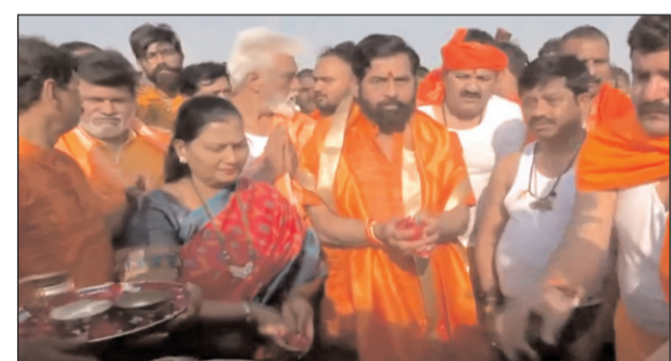
रहा है। उन्होंने यह भी कहा कि यहां व्यवस्थाएं बहुत अच्छी हैं। खुद सीएम समेत यूपी सरकार की पूरी टीम इसमें लगी हुई है। मैं

प्रयागराज, 24 फरवरी। महाराष्ट्र के डिप्टी सीएम एकनाथ शिंदे ने अपने परिवार के साथ उत्तर प्रदेश के प्रयागराज में त्रिवेणी संगम में पवित्र डुबकी लगाई और पूजा-अर्चना की। उन्होंने कहा कि यहां आना एक अद्भुत अनुभव है। यह आस्था और सद्भाव की भूमि है। हमने आज त्रिवेणी संगम पर पवित्र डुबकी लगाई है। यह महाकुंभ पवित्र है और 144 साल बाद हो