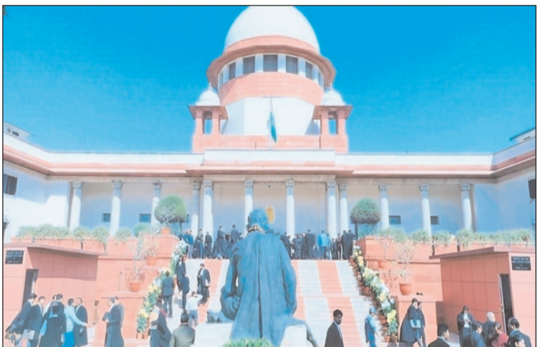
और राजस्थान के कुछ जिले शामिल हैं। अदालत ने कहा कि यदि कचरे को सही तरीके से अलग नहीं किया गया, तो कचरे से ऊर्जा बनाने वाली परियोजनाएं भी अधिक प्रदूषण पैदा करेंगी। प्रदूषण मामले में न्यायमित्र एवं वरिष्ठ

राष्ट्रीय राजधानी क्षेत्र (एनसीआर) में दिल्ली के अलावा हरियाणा, उत्तर प्रदेश