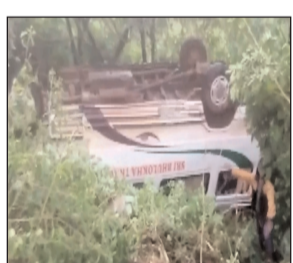
सूत्रों का कहना है कि इस घटना में 19 यात्री घायल हो गए। उन्हें कड़ा धाम स्थित सामुदायिक स्वास्थ्य केंद्र (सीएचसी) ले जाया गया, जहां से उनमें से 12 को गंभीर हालत होने पर जिला अस्पताल ले जाया गया।

कौशांबी। कौशांबी जिले के कड़ाधाम क्षेत्र में सोमवार को एक बस के अनियंत्रित होकर पलट जाने से उस पर सवार मध्यप्रदेश के 19 तीर्थयात्री घायल हो गये। पुलिस सूत्रों ने यह जानकारी दी। सूत्रों ने बताया कि मध्यप्रदेश के सागर और दमोह जिलों के श्रद्धालु एक बस से अयोध्या से महाकुंभ स्नान के लिए प्रयागराज आए थे और चित्रकूट जा रहे थे। सूत्रों के अनुसार कड़ा धाम क्षेत्र में लेहदरी गांव के पास सम्भवतः चालक को झपकी आ जाने से बस अनियंत्रित होकर पलट गई। सूत्रों का कहना है कि इस घटना में 19 यात्री घायल हो गए। उन्हें कड़ा धाम स्थित सामुदायिक स्वास्थ्य केंद्र (सीएचसी) ले जाया गया, जहां से उनमें से 12 को गंभीर हालत होने पर जिला अस्पताल ले जाया गया।