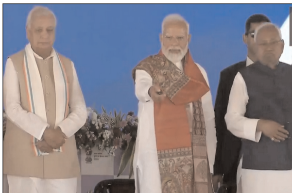
नरेंद्र मोदी ने कहा कि बाबा अजरीबीनाथ की इस पावन धरा पर इस समय महाशिवरात्रि की भी तयारियां चल रही हैं। ऐसे पवित्र समय में, मुझे पीएम किसान निधि की एक और किस्त देश के करोड़ों किसानों को भेजने का सौभाग्य मिला है। करीब 22 हजार करोड़ रुपये एक क्लिक पर

भागलपुर, 24 फरवरी। प्रधानमंत्री नरेंद्र मोदी ने सोमवार को बिहार के भागलपुर जिले से पीएम किसान सम्मान निधि योजना की 19वीं किस्त जारी की और विभिन्न विकास परियोजनाओं का उद्घाटन और शिलान्यास किया। प्रधानमंत्री ने भागलपुर से पीएम किसान योजना की 19वीं किस्त के तहत 9.8 करोड़ किसानों के बैंक खातों में 22,000 करोड़ रुपये ट्रांसफर किए। अपने संबोधन के शुरूआत में मोदी ने कहा कि महाकुंभ के समय में मंदराचल की इस धरती पर आना बड़ा सौभाग्य है। इस धरती में आस्था भी है, विरासत भी है और विकसित भारत का सामर्थ्य भी है। ये शहीद तिलका मांझी की धरती है और सिल्क सिटी भी है।