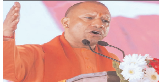
आजम खान को कुंभ मेले का प्रभारी बनाया था। योगी आदित्यनाथ ने कहा, लेकिन यहां मैं खुद कुंभ की समीक्षा कर रहा था और अब भी कर रहा हूँ। यही कारण है कि 2013 में जो भी कुंभ में गया, उसने अत्यवस्था, भ्रष्टाचार, प्रदूषण देखा। तब गंगा, यमुना और मां सरस्वती की त्रिवेणी में नहाने लायक पानी नहीं था। श्रीशंकर के प्रधानमंत्री इसका उदाहरण हैं जिन्होंने स्नान करने से इनकार कर दिया था। उन्होंने कहा, इस बार लगातार लोग आ रहे हैं। राष्ट्रपति, प्रधानमंत्री और उपराष्ट्रपति वहां आए। भूटान नरेश आए, दुनिया के सभी देशों के राष्ट्राध्यक्ष वहां आए। सभी ने इस कार्यक्रम में हिस्सा लिया और इसे सफल बनाया। उन्होंने कहा कि पहली बार उत्तर, दक्षिण, पूर्व, पश्चिम, सभी जगहों के लोग इस कार्यक्रम का हिस्सा बने और उन्होंने इसे सफल बनाया।

लखनऊ, 24 फरवरी। उत्तर प्रदेश के मुख्यमंत्री योगी आदित्यनाथ ने समाजवादी पार्टी (सपा) पर हमला करते हुए कहा कि उनके शासनकाल में तत्कालीन मुख्यमंत्री के पास कुंभ की समीक्षा करने का समय नहीं था और एक गैर सनातनी को इसका प्रभारी बनाया गया था। विधानसभा में अपने संबोधन में आदित्यनाथ ने कहा, हमने आपकी (सपा) तरह आस्था के साथ खिलवाड़ नहीं किया है। आपके समय में मुख्यमंत्री के पास आयोजन को देखने और समीक्षा करने का समय नहीं था, इसलिए उन्होंने एक गैर सनातनी को कुंभ का प्रभारी नियुक्त किया था। आदित्यनाथ 2013 में आयोजित कुंभ का जिक्र करते थे जब अखिलेश यादव मुख्यमंत्री थे और उन्होंने मोहम्मद