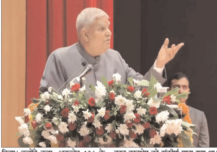
उन्होंने कहा, अनुच्छेद-136 के तहत हस्तक्षेप को संकीर्ण माना गया था।

यहां मध्यस्थता पर एक सम्मेलन को संबोधित करते हुए धनखड़ ने अनुच्छेद 136 के उपयोग एवं मध्यस्थता प्रक्रिया पर इसके प्रभाव की ओर ध्यान आकर्षित किया। उन्होंने कहा, अनुच्छेद-136 के तहत हस्तक्षेप को संकीर्ण माना गया था।